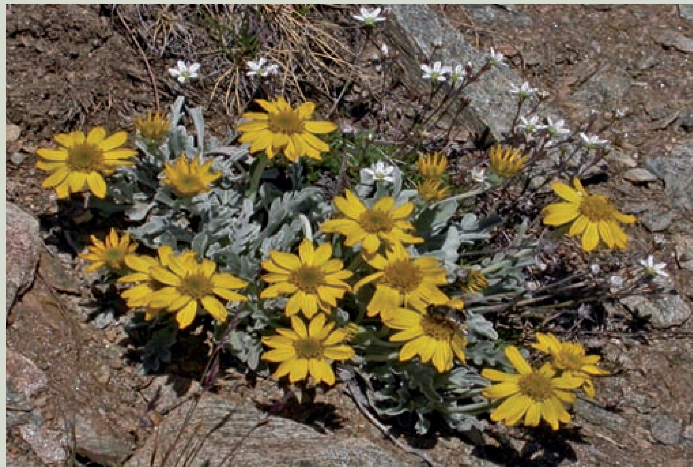
Das Hallers Greiskraut ( Senecio halleri ) wächst auf steinigem Böden und besiedelt lückige Pionierrasen. Es ist wie viele andere Alpenblumen klein und unscheinbar und durch Tritt gefährdet. Auf dem Blumenweg Grundberg erleben Sie die Vielfalt der Alpenblumen. Er führt vom Kreuzboden über die Triftalp nach Saas Grund hinunter.

Viele Farbtupfer können Sie auf Ihrer Wanderung in den Bergmatten entdecken. Einige Pflanzen haben leuchtende Blüten, andere sind schwieriger zu erkennen, wie beispielsweise der Keltische Baldrian mit seinen unscheinbaren, kleinen und zarten Blüten. Dieser wächst gerne auf kargen Rasen, insbesondere auf den Rücken der windexponierten Kuppen. Hier oben weht der Wind durch unser Haar und drückt die Pflanzen zu Boden. Dies macht den Pflanzen wenig aus, Trittschäden und Bodenerosion können ihren Lebensraum jedoch zerstören. In der Schweiz kommt der Keltische Baldrian nur im Saastal vor. Einer der wenigen Standorte ist der Moränenhügel am Weg zur Weissmieshütte. Deshalb ist dieses Gebiet geschützt. Bitte bleiben Sie auf den markierten Wegen.