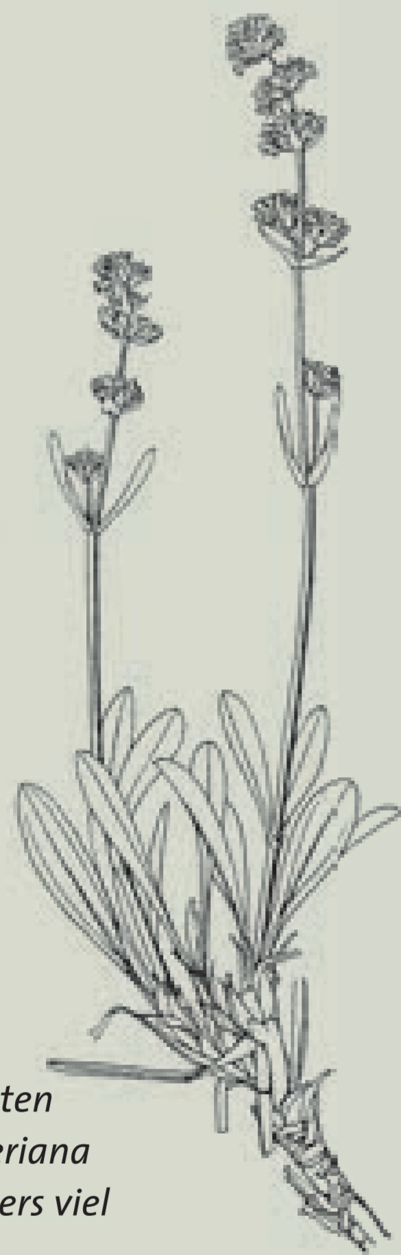
Die Wurzeln des geschützten Keltischen Baldrians ( Valeriana celtica ) enthalten besonders viel ätherisches Baldrianöl.