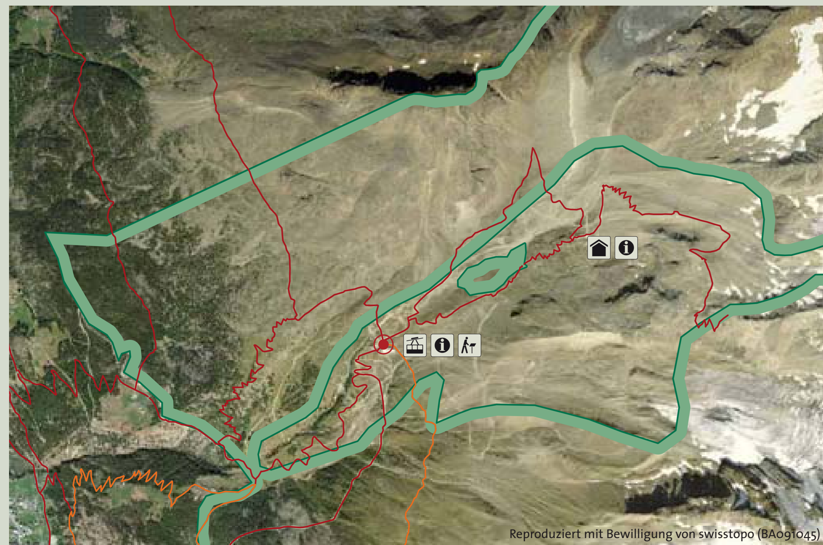
Reproduziert mit Bewilligung von swisstopo (BA091045)

Up there the wind blows through our hair and presses down the flowers. This doesn't disturb the plant, but its habitat is destroyed when it is walked over or eroded. In Switzerland, Alpine Valerian exists only in Saastal. One of the few locations is the moraine hill on the way to the Weissmieshütte. Therefore this area is reserved for these rare plants. For the protection of nature, please stay on the marked hiking trails.